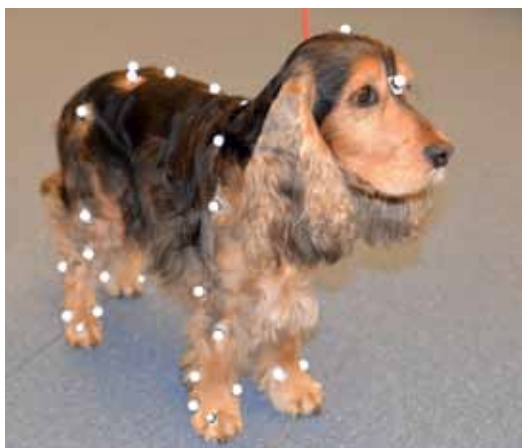
Så här fin och prickig blir man när det är klart!

– Genom att jämföra rörelsen i det friska knäet med det opererade, kan vi få en bild över hur väl funktionen