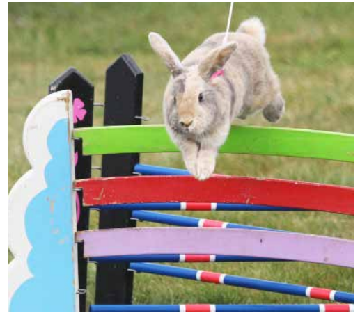
Under Djurens helg kör även kaniner agility.

Saker som händer tre år i rad blir en tradition och 2018 var det tredje gången som vi var med på Agria Djurförsäkringars event; Djurens Helg. Under två dagar, den 11-12 augusti, fylldes Stockholms travbana Solvalla med djur av olika slag. Det är hästar, kor, får, höns och andra fåglar, smådjur och kräldjur och givetvis massor med hundar. De senare ges även chans att tävla officiellt i freestyle och rallylydnad. Men till skillnad från de flesta andra arrangemang där tävlingar står i fokus är Djurens Helg för de besökande. Framförallt är det barnfamiljer som lockas till Solvalla, här borde det finnas något att titta på och göra för de flesta. Vi har vår monter på plats och förutom att rita på t-shirts, ta Hundborgarmärket och pyssla har vi hundar som gillar att bli klappade. Efter en lång värmebölja kom regnet till Stockholm på söndagen och det gjorde nog att antalet besökare inte slog rekord det här året.