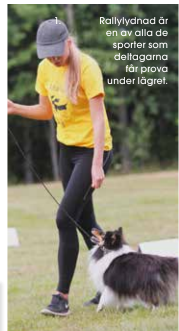
1. Rallylydnad är en av alla de sporter som deltagarna får prova under lägret.