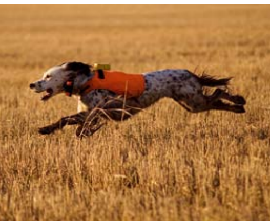
Kllossning förekommer även inom engelsk setter, precis som gordonsetter en utpräglad jakthundsras. Utbredningen i rasen är inte känd.

*Diskussioner pågår om att sjukdomen ska byta namn till symmetrisk onychomadesis (SO).