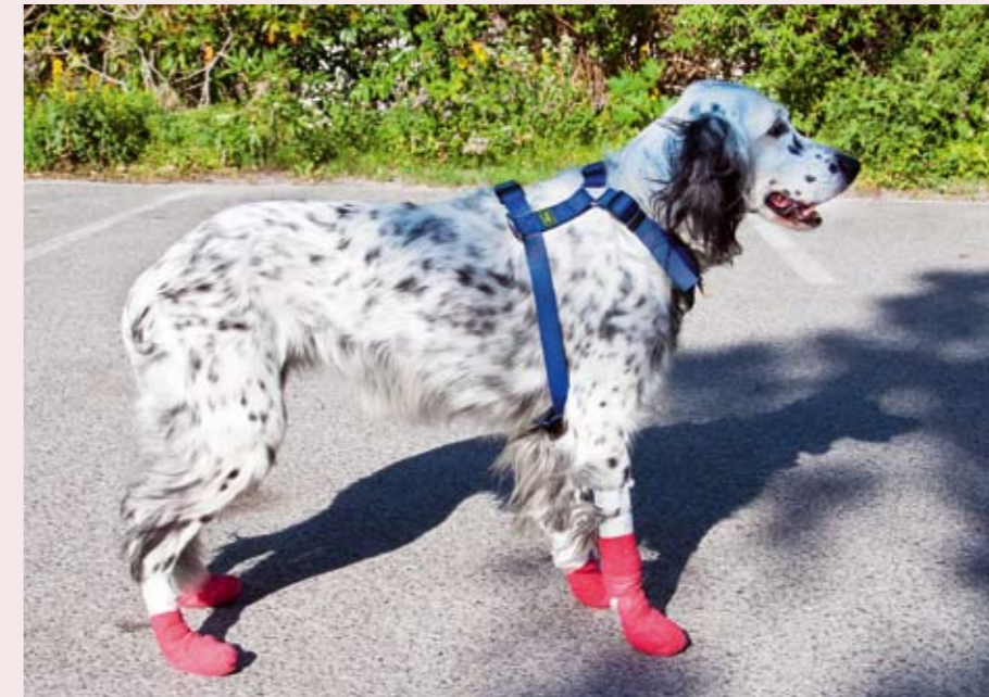
När sjukdomen är fullt utvecklad är samtliga klor på alla fyra tassar angripna.

tredjedelar av hundarna i Martine Lund Ziener material debuterade sjukdomen under sommaren och hösten, med en klar topp under jaktmånaden september.