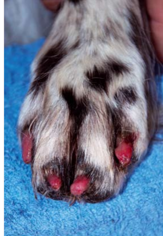
Klolossning är en smärtsam sjukdom som innebär att hunden på kort tid tappas flera eller samtliga sina klor. Sjukdomen kan vara plågsam att vara med om även för hundägaren. Det händer att hundar av den här anledningen avlivs under akutfasen, men de flesta blir bra igen när klorna kommit tillbaka. Hunden på bilden har drabbats av sekundära infektioner, vilket kan ske när klokapseln inte längre skyddar pulpan.

Fortfarande vet man inte vad som gör att klolossning bryter ut och inte heller varför sjukdomen bryter ut vid en viss tidpunkt. Några teorier finns. En handlar om att hård belastning av tassar och klor kan trigga igång processen. Hos två