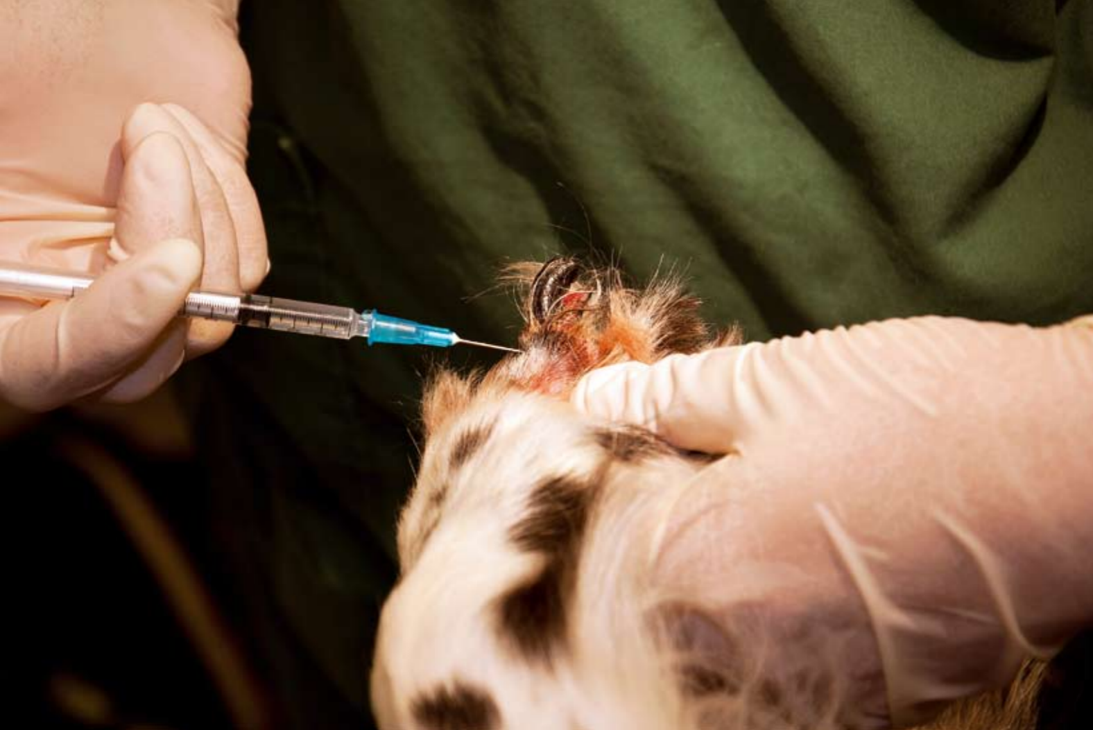
När klokapseln börjat lossna måste den dras ut av veterinär. Det görs under narkos eller ibland lokalbedövning.

– Detta visar att vi bara om vi är öppna med problemen istället för att gömma dem har möjlighet att på sikt förbättra många aspekter av hälsa och välfärd hos våra hundar.