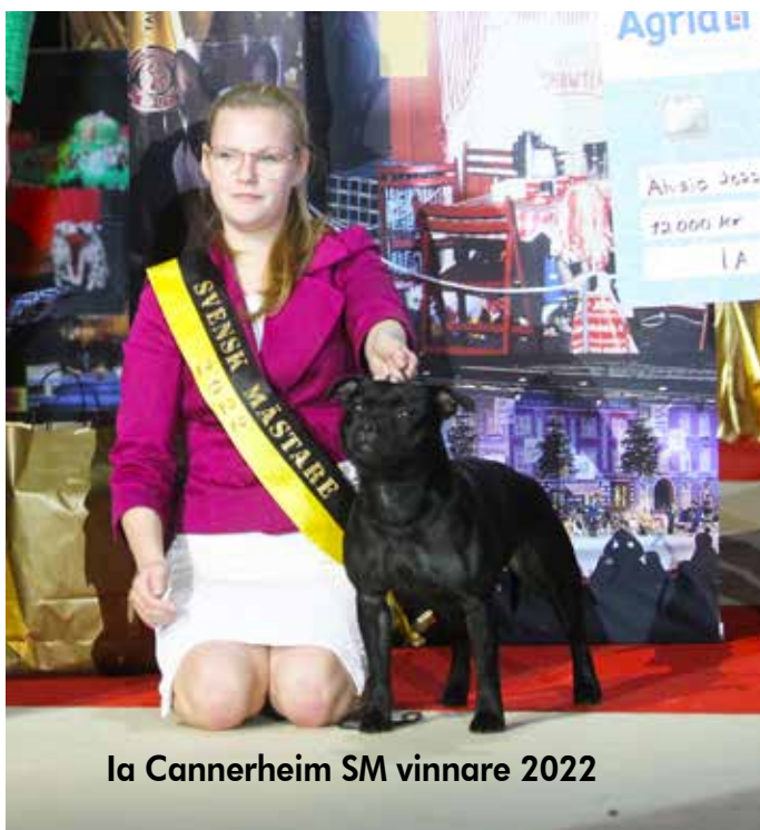
Ia Cannerheim SM vinnare 2022