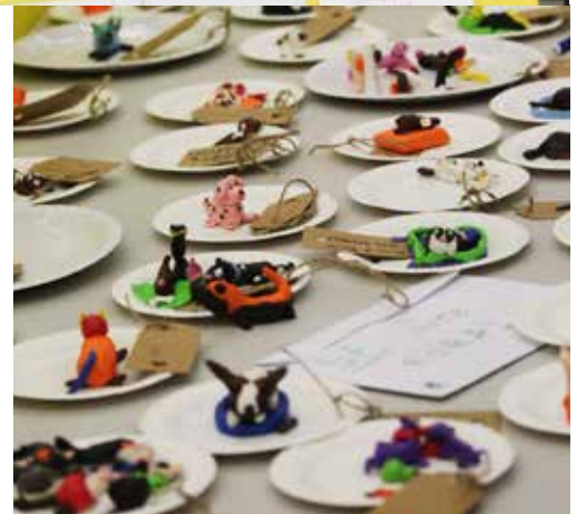
Till höger: ett litet urval av alla de fantastiska skapelser i lera som barn och ungdomar gjorde under helgen.